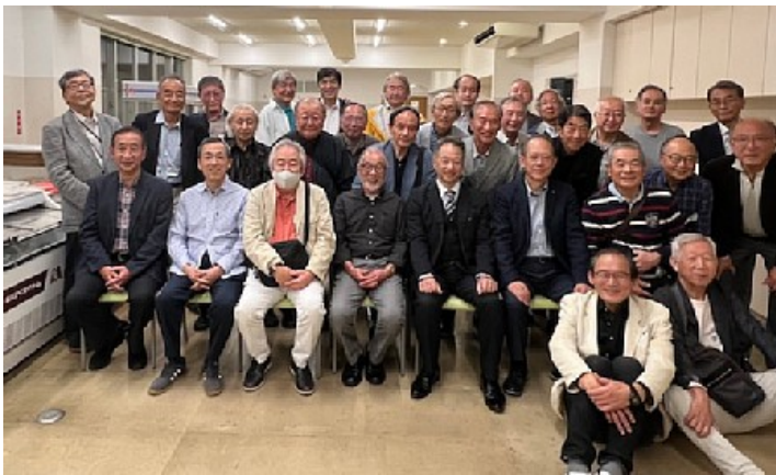
一次会の最後に全員で記念撮影↓

午後5時を過ぎ諸川先生や十数名の同期が二次会の準備・所用で退席された後であったが、校長を交えて再度記念撮影を行った。