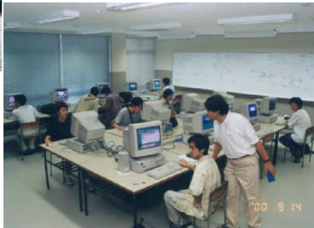
数学科のコンピュータ室