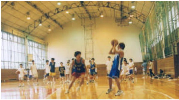
天井と壁を新装した体育館