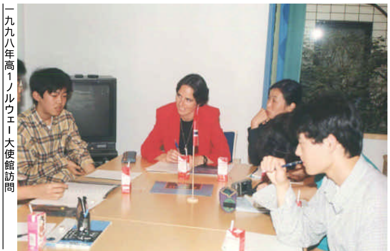
一九九八年高1ノルウェー大使館訪問

麻布高校、韓国へ・学年旅行の遠距離化 六年間の行事の中で最も規模の大きいものは、何と云っても「学年旅行」だ。かつては、学年全員が同じ地域を旅行していたが、平成二年から四国・関西など、様々なコースに分かれるようになった。また以前は、悪天候等の影響を顧慮して、移動手段として航空機は使われていなかったが、職員会議での二、三年にわたる議論を経て、平成五年の高一の北海道旅行で初めて使用された。以降、北海道・九州・沖縄など、国内各地を訪れている。 平成九年に高二で韓国コースが企画され、約四〇名の生徒が国境を越えた。訪問先は慶州、ソウル。旅行代理店との折衝には、教員と生徒代表による旅行委員があたり、単なる物見遊山に終わらせないところは他のコースと同じだが、参加者はさらに、ハンゲル語などの研修を受けている。 以降、このコースは定着した観もあるが、「近くて遠い」(『論集97』生徒投稿)国にふれて、世界観を新たにした生徒が多いようだ。