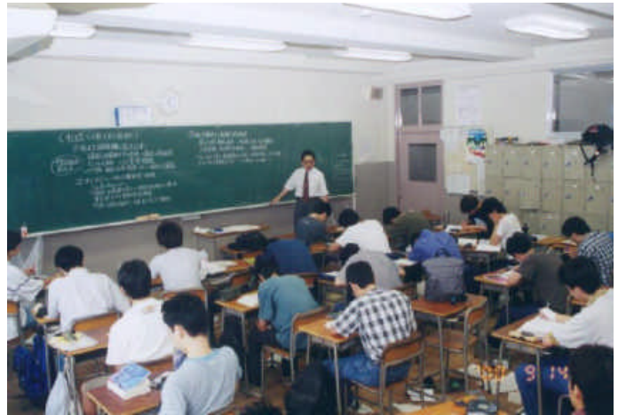
7クラス化で新設した高三教室