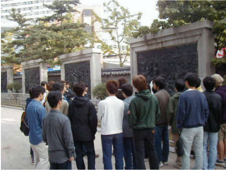
二〇〇〇年高2韓国コース