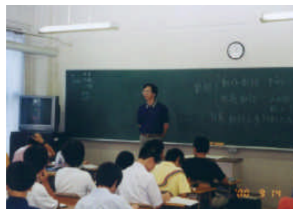
お気づきですか？ 時計とビデオモニターが入りました。(中一教室)