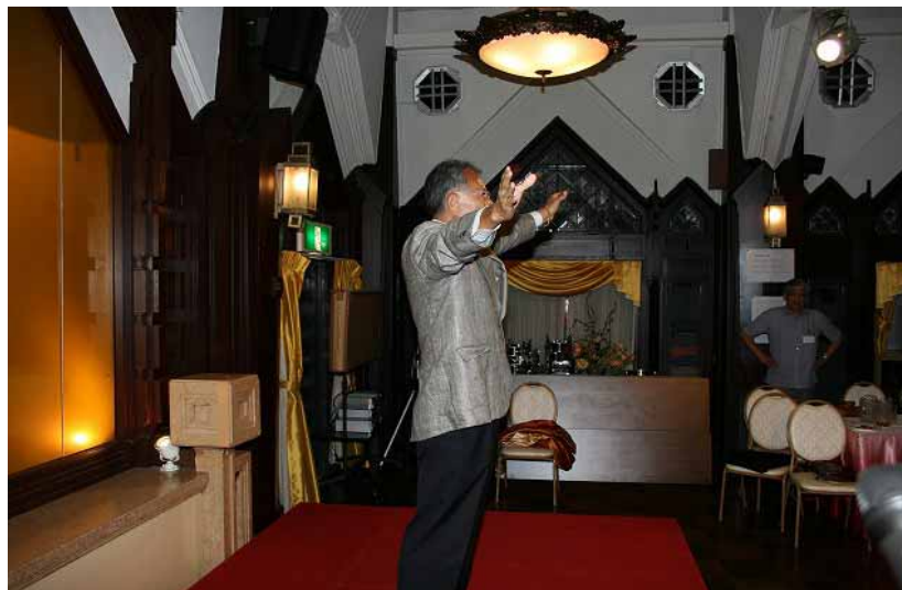
校歌斉唱でお開き

次回開催予定 2011年7月8日（金） 午後5時より 会 場 銀座ライオン6階 宴会場